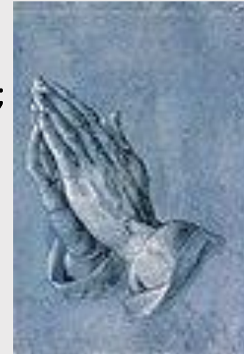
Albrecht Dürer, Betende Hænder (1508)

fides ex auditu => hørelsen har første prioritet i troen på en usynlig Gud; hørelsen: budskabets aktualiserende kanal